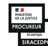
7. Cartes services

Éléments servant à matérialiser la présence des services au COD.